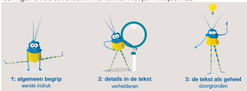
De drie fases van Close Reading