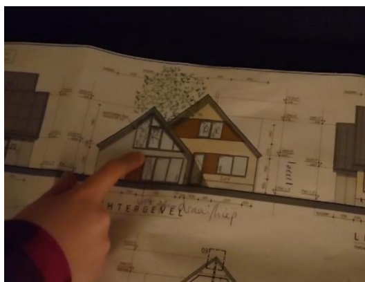
Van echte plattegrond van het huis...

Nu is de opdracht om een maquette van het huis te maken. Dit doet iedereen ontzettend goed! Er wordt gewerkt met papier, karton, hout, kapla en lego. Eind januari zijn de maquettes klaar en gaan we ze van elkaar bekijken. Hieronder een aantal foto's van wat er tot nu toe gemaakt is. De maquettes zien er zo al gaaf uit en dan moeten ze zelfs nog afgerond worden!