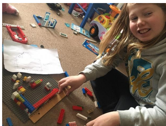
een schaalmodel van lego