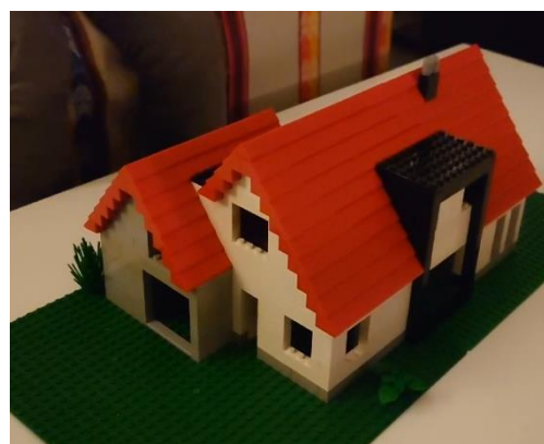
...tot lego-maquette op schaal